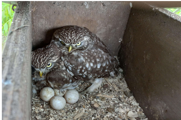
2 dames op 5 eieren

Het feit dat er meer objecten in onze regio voorkomen die leeg staan en slecht zijn onderhouden heeft een enorme aantrekkingskracht op de steenuiltjes. Ze zijn gek op onze kasten maar de voorkeur gaat toch wel uit naar die leegstaande objecten. Zo hebben er dit jaar 4 paartjes voor gekozen om buiten onze nestkasten te broeden. Daarbij was een paartje, waarvan we wisten dat het aanwezig was, maar we konden de nestplaats niet traceren. Later bleek dat het paar een jong had grootgebracht in een opslagplaats van hakhout. Omdat het hakhout deze winter opgestookt gaat worden hebben