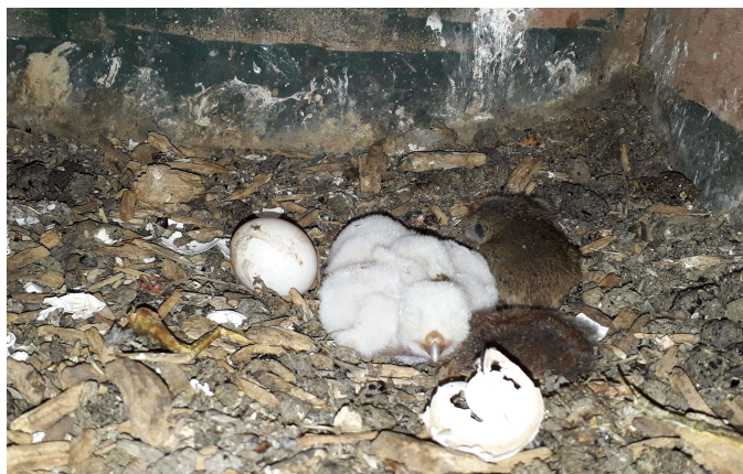
Jongen van 1 dag oud en twee veldmuizen

Het is elk jaar weer een hele klus om alle nestkasten te controleren. Veelal lukt dat ook niet omdat de steenuilen broeden tussen het weidevogelseizoen en het kerkuilenseizoen in. Elk jaar moeten we weer keuzes maken. Meestal controleren we de vaste broedlocatie en de plaatsen waar steenuilen worden gemeld als eerste. Als er wat meer tijd beschikbaar is controleren we de overige kasten met soms een verrassend resultaat. Het blijft elk jaar weer spannend.